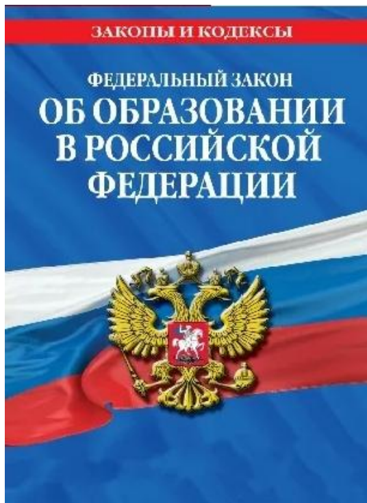
Федеральный закон от 29.12.2012 № 273-ФЗ